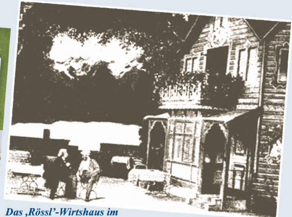
Das ‚Rössl‘-Wirtshaus im Bühnenentwurf von 1897 war der Villa Blumenthal ähnlich ...

Hier einige der Romane, Dokumentationen und Sachbücher, in denen die Villa Blumenthal eine bedeutende Rolle spielt